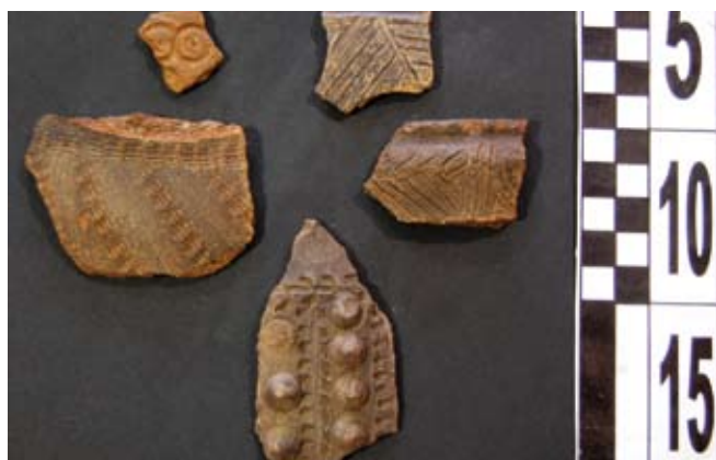
Fig. 4. Restos de cerámica castrexa atopada na escavación.

A primeira das fases de ocupación documentada, relacionada cos diferentes elementos defensivos atopados, como foxos e parapetos, pertence a un período prerromano se atendemos tanto á estratigrafía como aos materiais cerámicos recuperados (fig. 4), posiblemente da fase final da Idade do Ferro, xa moi preto do cambio de Era.