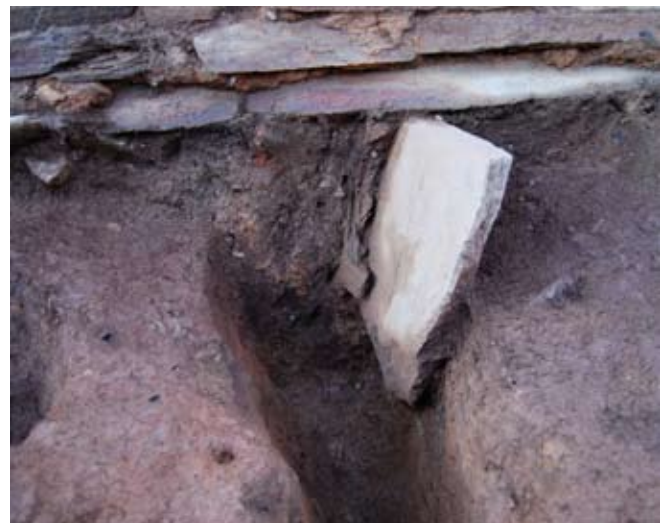
Fig. 7. Muro do período flavio construído sobre os restos de fondos de cabana e buratos de poste de fases anteriores.

Como xa se comentou anteriormente, a nivel superficial non se evidencia ningún tipo de elemento defensivo debido ao completo arrasamento que sufriron co desmonte dos parapetos térreos, utilizados con case toda probabilidade para o recheo con terra dos foxos existentes, e que tan só se puideron observar nos perfís resultantes (fig. 5) da gabia aberta para a instalación dos novos entubados.