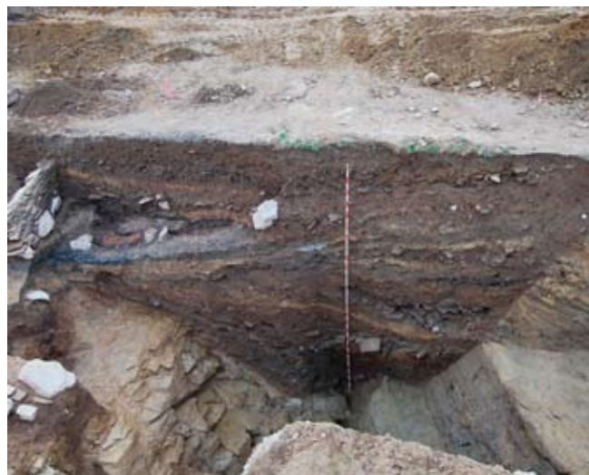
Fig. 5. Foxo 1. Perfil sur da gabia.

Estes elementos defensivos, consistentes en varios foxos 6 escavados no substrato natural, así como parapetos térreos 7 , do que á espera de posteriores intervencións que poidan corroborar ou non a nosa hipótese, deducimos que foron desmontados intencionadamente na seguinte fase, aproveitando o seu volume de terra para, deste xeito, encher de terra os foxos co fin de amortizar o conxunto de elementos defensivos do asentamento e crear unha nivelación do terreo.