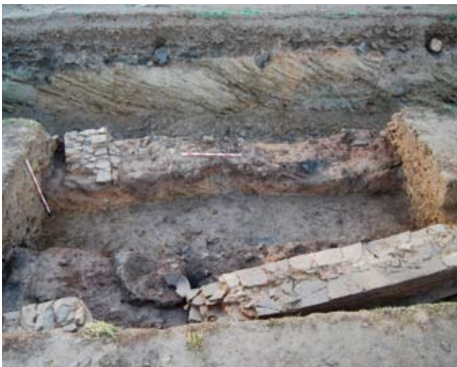
Fig. 8. Estancia na Sondaxe 2, realizada en cachotería de lousa.

A seguinte etapa construtiva que atopamos durante a realización da intervención caracterízase pola construción de edificacións a base de muros de cachotería de lousa tomados con arxila local, cunha clara tipoloxía construtiva