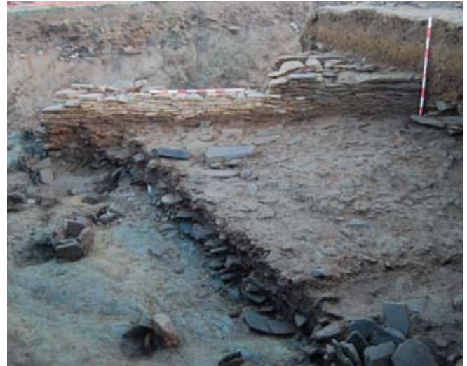
Fig. 6. Buratos de poste por debaixo dos niveis anteriores ás construcións romanas na Sondaxe 1.