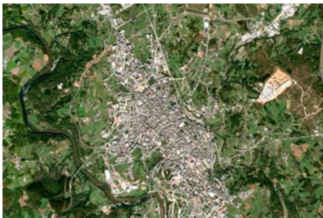
Fig. 1. Situación do asentamento respecto ao río Miño e á cidade de Lugo.

No presente traballo ofrecemos unha síntese das primeiras valoracións sobre a intervención arqueolóxica levada a cabo nun asentamento inédito ata o momento.