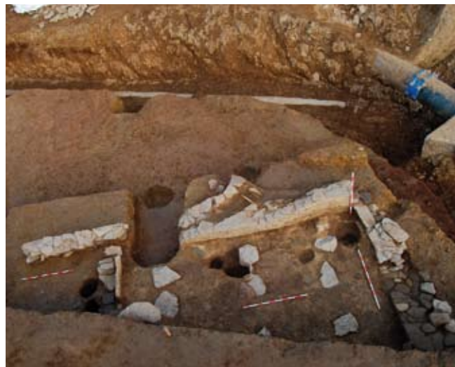
Fig. 9. Estancias da Sondaxe 4.

romana (fig. 8), igual que os aparecidos na cidade durante as mesmas datas, deixándose de utilizar, como elemento construtivo maioritario, os buratos de poste. Entre os materiais recuperados aparecen restos de instrumentos de tear, como fusaiolas e pesas, ademais de tégula , T.S. (a maioría Hispánica, de época flavia), cerámica común, vidros, fichas de xogo, unha lucerna de importación 12 , muíños circulares e abundantes bronzes e obxectos de ferro. Unha primeira aproximación ao estudo dos materiais recuperados desta fase, sitúaos a partir da primeira metade do século I, sobre todo a partir de época flavia, ata finais do século II e principios do III.